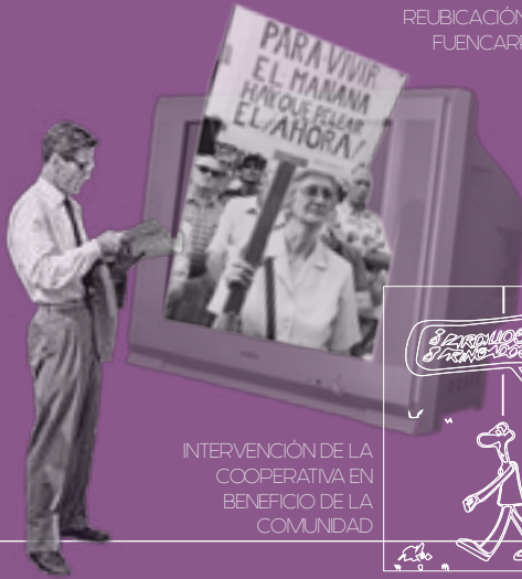
INTERVENCIÓN DE LA COOPERATIVA EN BENEFICIO DE LA COMUNIDAD